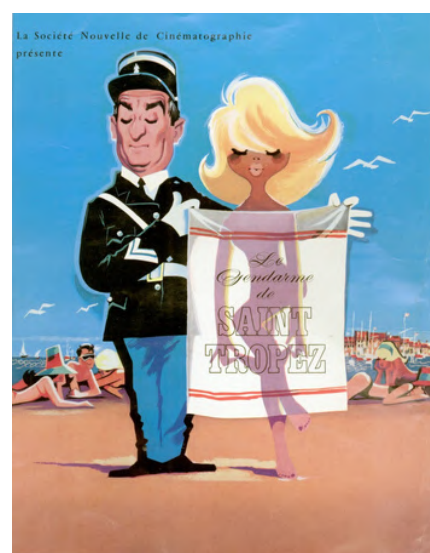
Affiche du film Le gendarme de Saint-Tropez

Une chose est sûre, depuis les prémices de la fiction audiovisuelle à la Belle époque, en passant par Cruchot dans les années 1970 et jusqu'à Marleau, aujourd'hui « les gendarmes crèvent l'écran ».