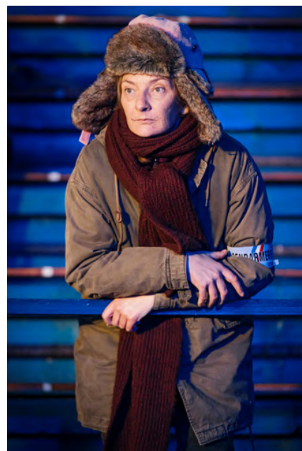
Photogramme de la série TV Capitaine Marleau

« Un petit thé mon adjudant-chef ? », « Youyou c'est la Maréchaussée », la tactique du gendarme sont, parmi beaucoup d'autres, des références cultes qui résonnent dans l'esprit du grand public. Qui ne connaît pas Cruchot et la saga du gendarme de Saint-Tropez, Une femme d'honneur, la capitaine Marleau ou encore Section de recherches ? Ces figures populaires sont la trame de l'exposition, tout comme des pièces exceptionnelles et inédites : la porte du cockpit de l'AirBus A300 lié à la prise d'otages à Marignane en 1994, la carabine de l'affaire Dominici, les photos des coulisses de Peur sur la ville avec Jean-Paul Belmondo, etc. La collection du Musée de la gendarmerie nationale vient quant à elle en soutien des films choisis pour faire le parallèle entre la représentation dans la fiction et la «réalité» des objets.