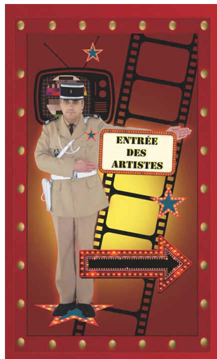
Ambiance scénographique : cadres lumineux, silhouettes, tapis d'étoiles