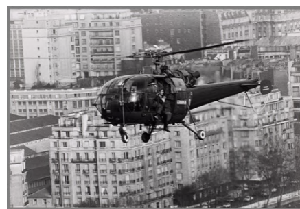
Photo de tournage de Peur sur la ville avec Jean-Paul Belmondo dans un hélicoptère de la Gendarmerie nationale

Des cadres lumineux aux allures de miroirs de loges serviront de vitrines d'exposition aux différents objets et photographies. Au cœur de l'exposition, une salle de cinéma prend place pour diffuser des extraits longs de certains films qui font la part belle au gendarme. Décorée d'affiches de films, elle immergera le public dans l'ambiance intimiste des salles de projection.